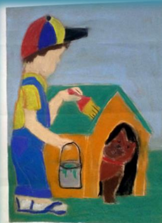
1. место млађи узраст НЕНАД БОГАСЕНИЕВ, 2-3, ОШ „Турга Јаковић“ Копаоник Учитељица: Милена Милићкић